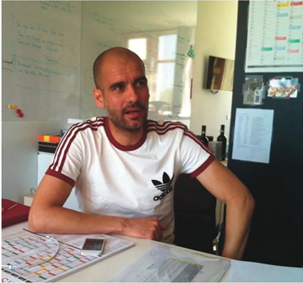
Boven: Pep Guardiola in zijn kantoor aan de Säbener Strasse na het winnen van de Duitse beker. Onder: Lorenzo Buenaventura vertelt de auteur hoe het trainingsprogramma in elkaar steekt.