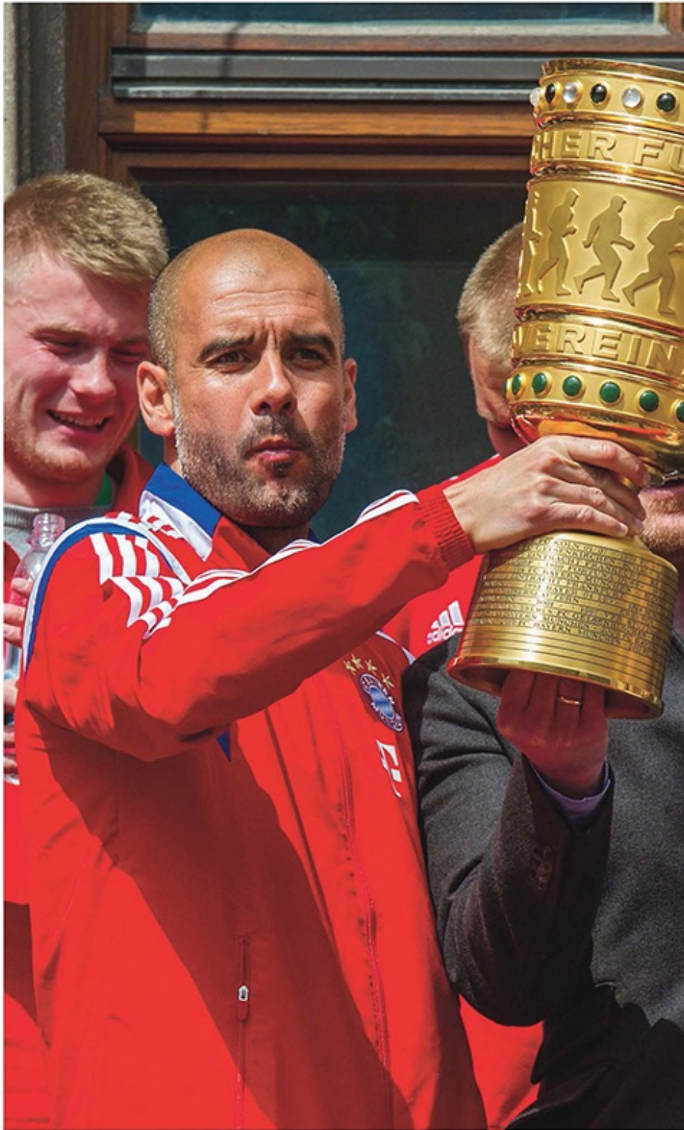
De vierde titel van het eerste seizoen, de Duitse beker, wordt door Guardiola op het balkon van het gemeentehuis in München aan de fans gepresenteerd.