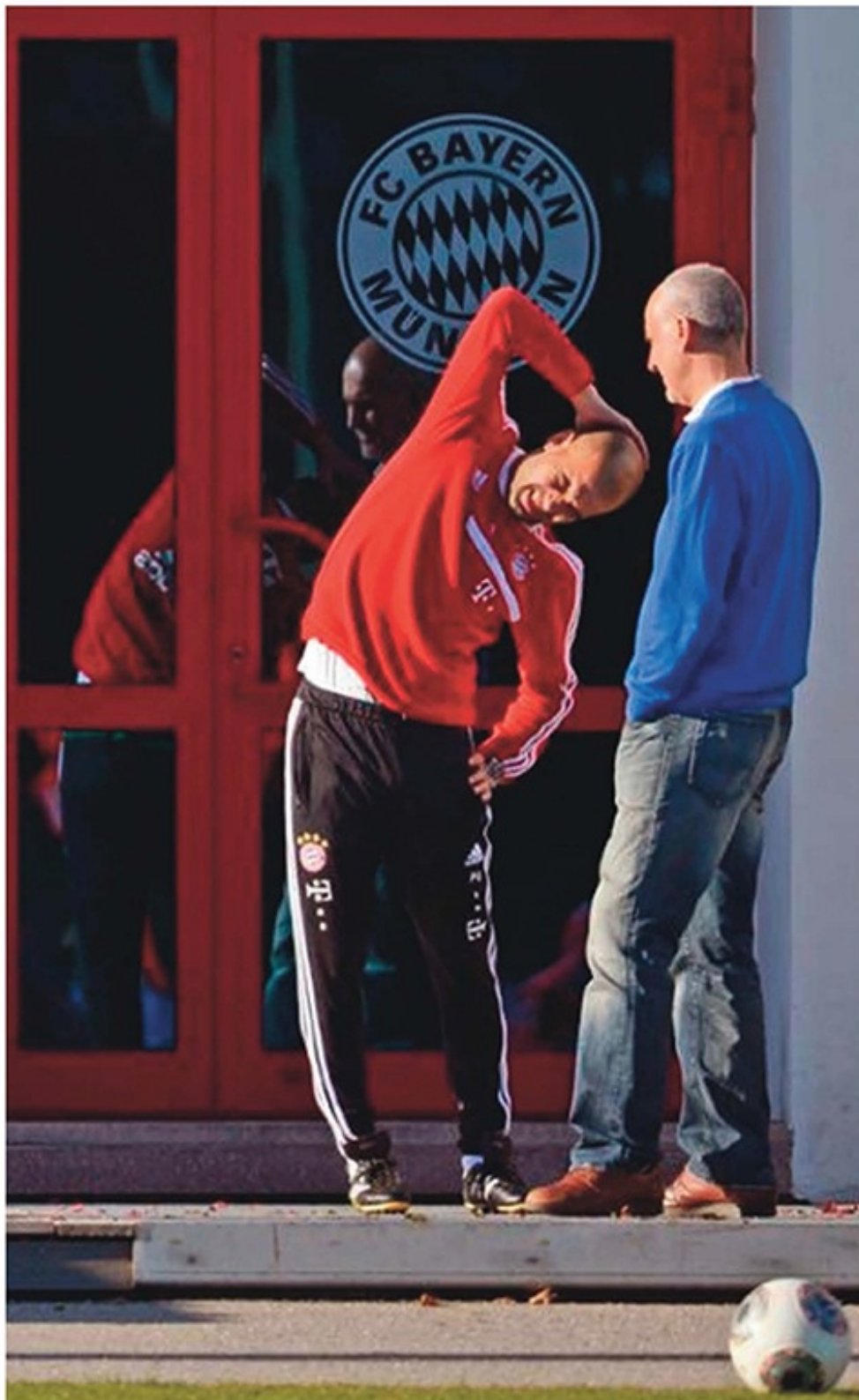
Terwijl Pep Guardiola voor de ingang van de kleedkamers rek- en strek-oefeningen doet, bespreekt hij met de auteur de trainingssessie die net is afgerond op het complex van Bayern München.