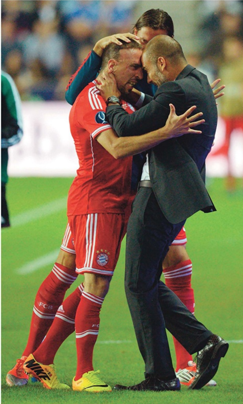
Franck Ribéry en Guardiola vieren het doelpunt van de Franse buitenspeler tegen Chelsea tijdens de door Bayern gewonnen wedstrijd om de Europese Supercup in Praag.