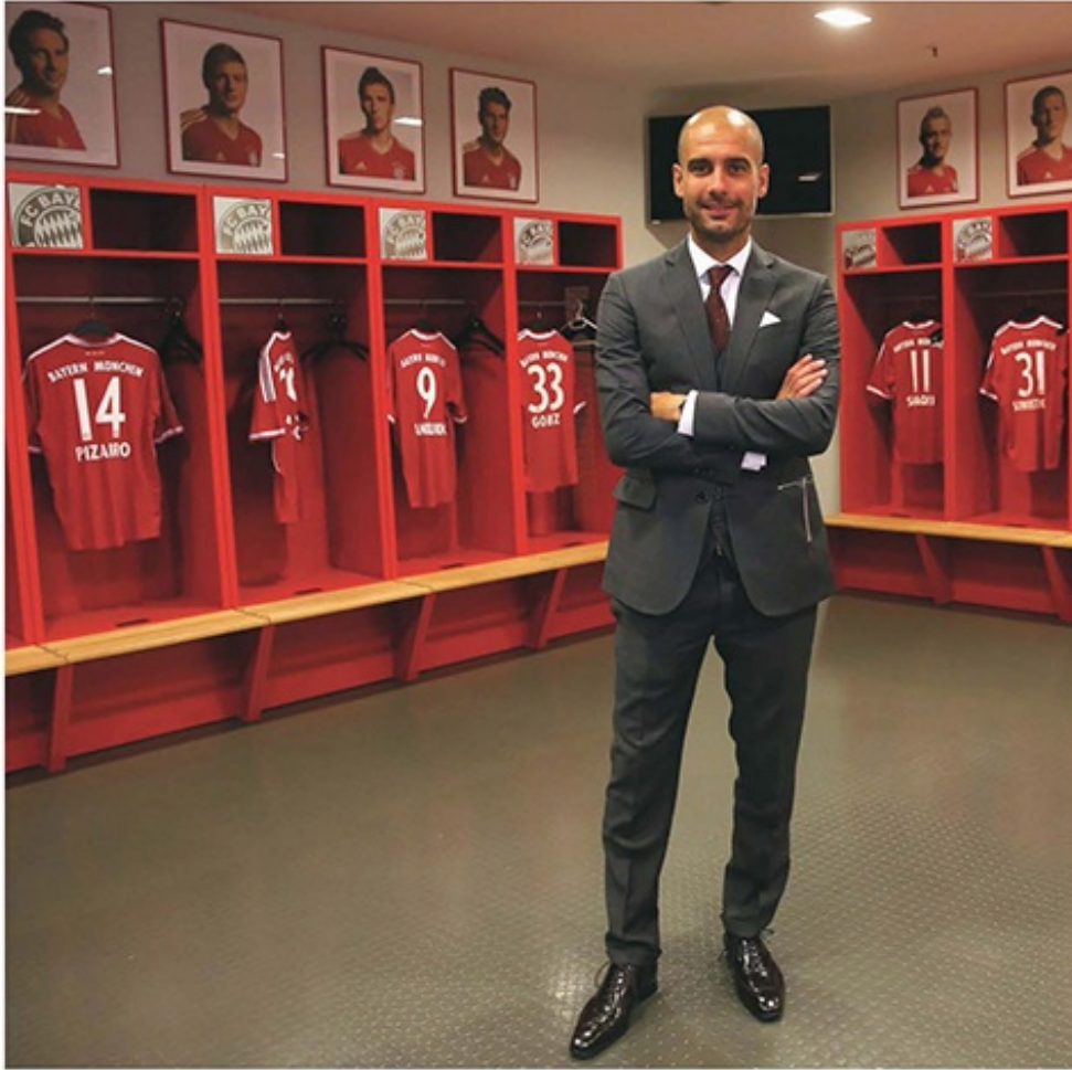
Boven: Pep Guardiola in de kleedkamer van de Allianz Arena op de dag dat hij gepresenteerd werd als de nieuwe coach van Bayern München. Onder: Op het hoofdveld van de Säbener Strasse bespreekt Guardiola de details van de positiespellen en looplijnen die hij oefent met zijn spelers.